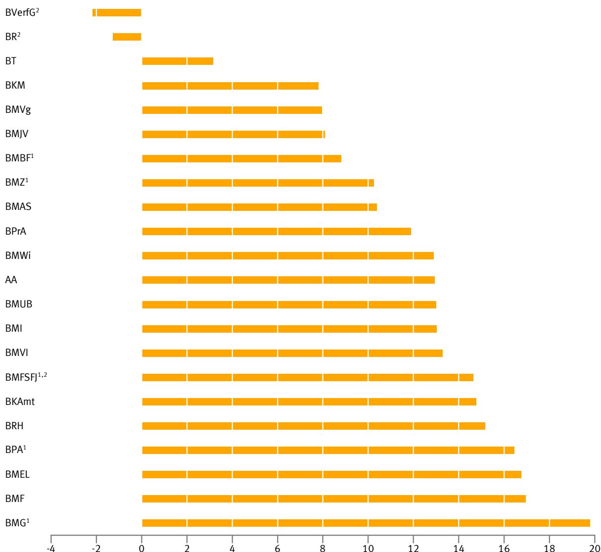
Abb 2 Unterschied zwischen dem Frauenanteil im höheren Dienst und dem an allen Leitungsfunktionen in den obersten Bundesbehörden am 30. Juni 2015 in Prozentpunkten