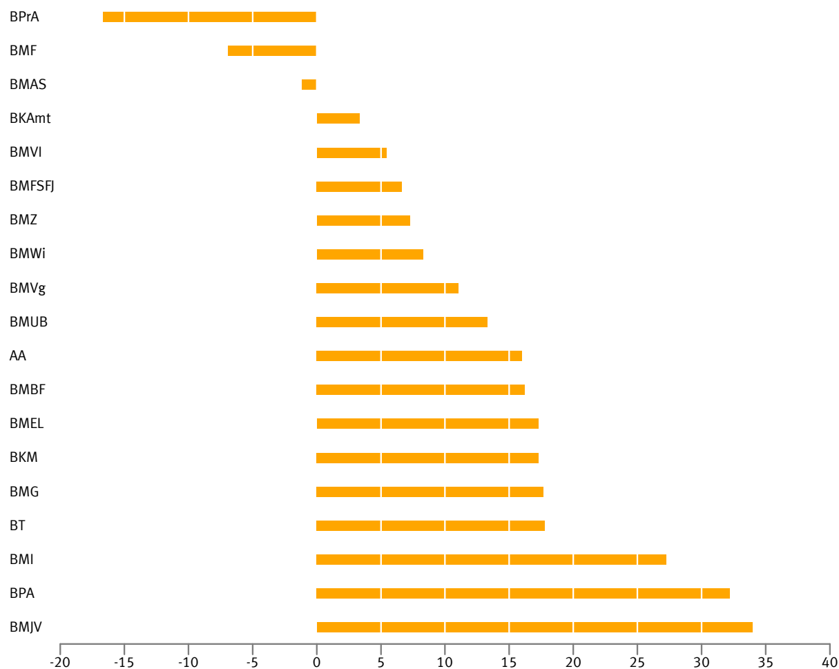
Abb 3 Unterschied zwischen dem Frauenanteil an Referats- und Unterabteilungsleitungen in den obersten Bundesbehörden am 30. Juni 2015 in Prozentpunkten

BVerfG, BR und BRH verfügen über keine den Unterabteilungsleitungen vergleichbare Führungsebene und sind hier deshalb nicht dargestellt. – Ohne BBk.